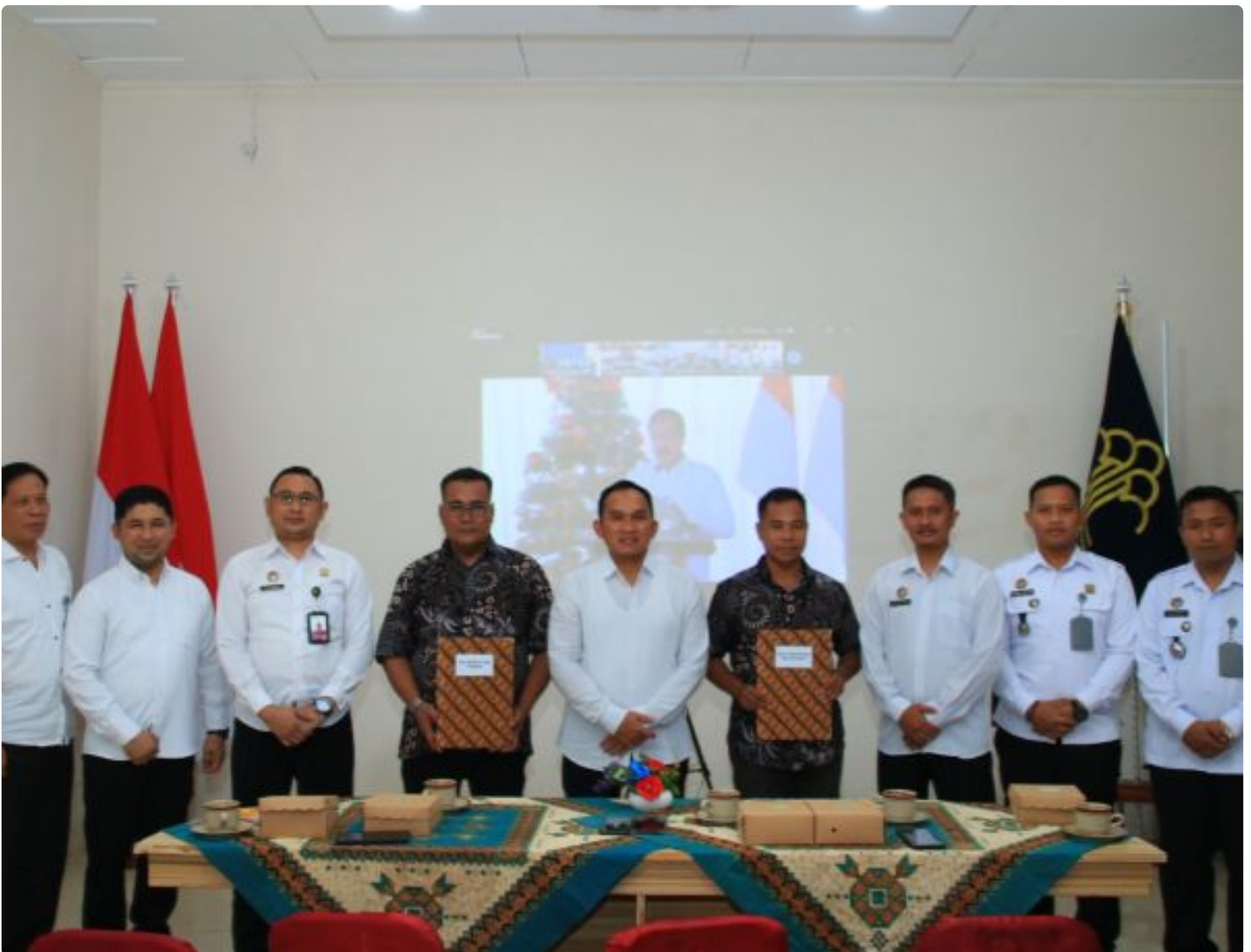
Penyerahan remisi khusus bagi warga binaan yang beragama Nasrani di Lapas Banyuwangi

BANYUWANGI – Perayaan Hari Raya Natal menjadi momentum kebahagiaan tersendiri bagi Warga Binaan Lembaga Pemasyarakatan (Lapas) Kelas IIA Banyuwangi yang beragama Kristen. Pasalnya, enam orang Warga Binaan mendapatkan remisi atau pengurangan masa tahanan pada Rabu 25 Desember