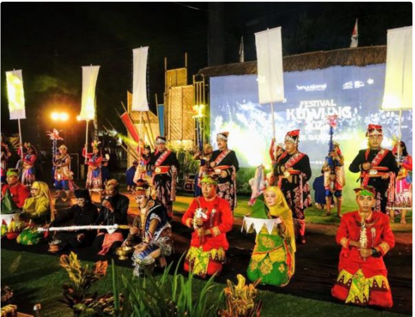
Tarian tradisional Banyuwangi dalam Festival Kuwung 2024

BANYUWANGI – Festival Kuwung yang sempat vakum selama 5 tahun, berhasil digelar kembali dengan menyuguhkan bentuk keharmonisan dalam kekayaan seni budaya Bumi Blambangan dan sukses memukau ribuan penonton. Berbeda dari tahun-tahun sebelumnya yang selalu diadakan di pusat kota Banyuwangi,