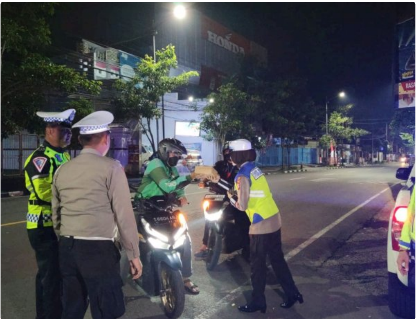
Satlantas Polres Bojonegoro membagikan makanan sahur ke pengguna jalan

BOJONEGORO - Satuan Lalu Lintas (Satlantas) Polres Bojonegoro kembali melaksanakan bakti sosial dengan membagikan makanan sahur kepada warga masyarakat yang membutuhkan, Senin (25/3/2024) dini hari.