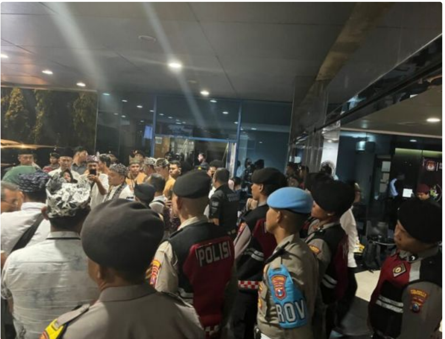
Puluhan personel Polresta Banyuwangi mengamankan jalannya debat perdana Pilbup Banyuwangi 2024 di JTV Surabaya, Minggu (27/10/2024) malam.

BANYUWANGI - Menjadi salah satu momen penting dalam pengamanan tahapan Pilkada Banyuwangi 2024, kali ini Polresta Banyuwangi mengerahkan puluhan personel untuk mengamankan jalannya debat perdana yang